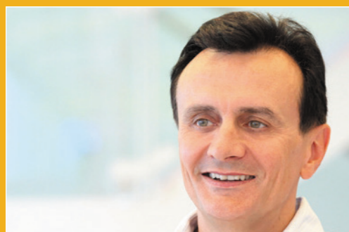
Pacal Soriot az AstraZeneca vezérigazgatója